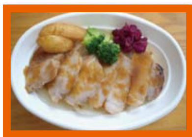
まる豚 ステーキ重