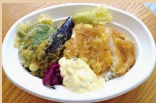
赤城鶏揚げ 南蛮弁当