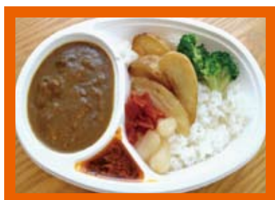
シェフの作った ビーフカレー