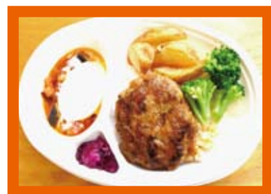
シェフ特製 ココモコ弁当